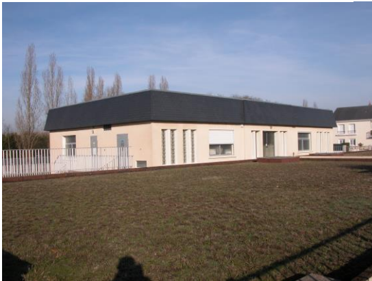
La station de Rosnay